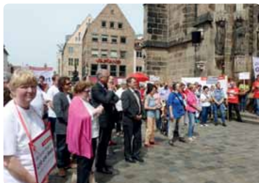
Der Demonstrationszug formiert sich vor der Lorenzkirche

Für uns als Träger von stationären Pflegeeinrichtungen wird es zunehmend schwieriger, gut ausgebildete Pflegefachkräfte zu bekommen bzw. junge Menschen für den Pflegeberuf zu begeistern. Belastende Arbeitsbedingungen, ein Einkommen, das einen Zweitjob nötig macht, um den Lebensstandard zu sichern, drücken das Ansehen des Pflegeberufs weiter nach unten und verschärfen den Fachkräftemangel.