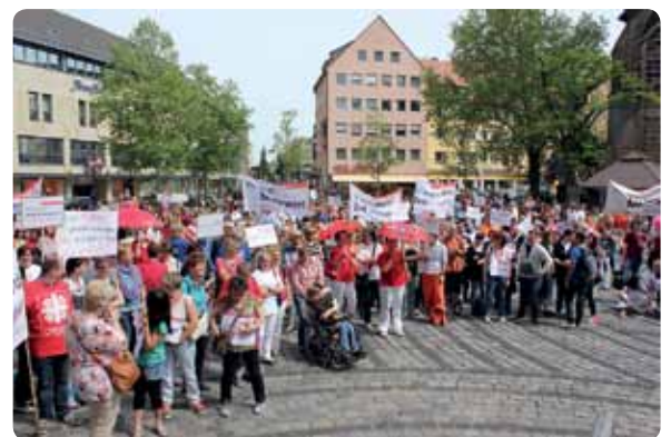
Schlusskundgebung am Jakobsplatz