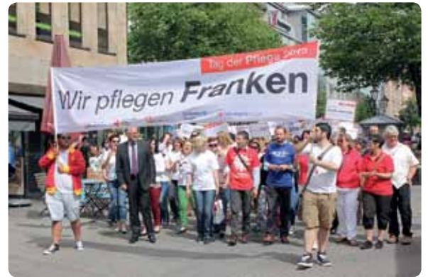
Demonstrationszug durch die Karolinenstraße